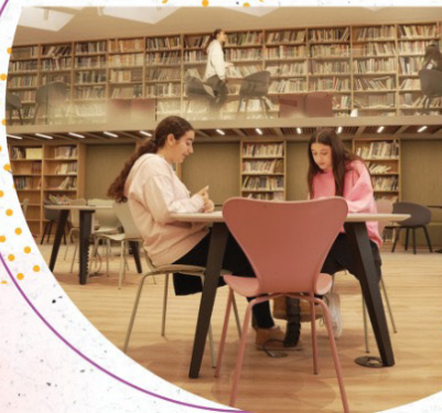
4. סרטוני ישראל