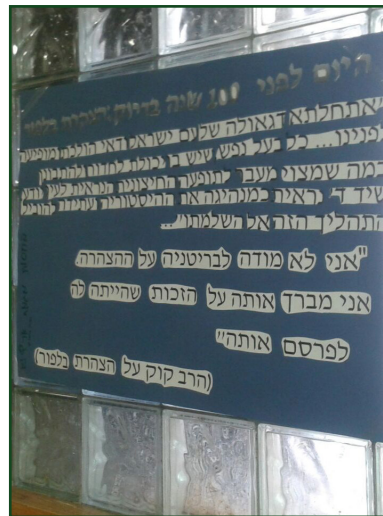
מאה שנה להצהרת בלפור