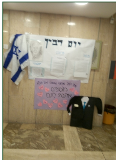
יום הזיכרון לראש הממשלה יצחק רבין