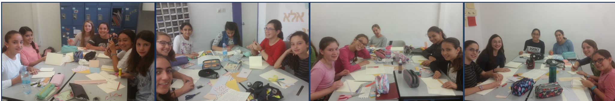
יצירה - שכבה ז'

ביום חמישי התקיימה יצירה לכיתות ז' שכללה הכנה של כרטיסי שנה. התלמידות עמלו והשקיעו בהכנת כרטיסים יפים ומיוחדים אשר הוקדשו לחברותיהן לרגל השנה החדשה.